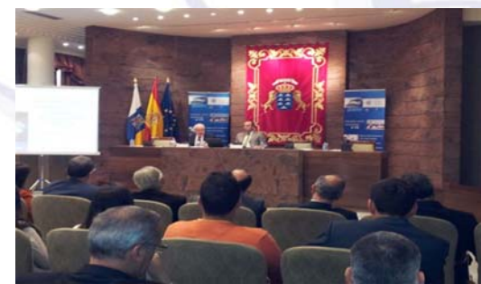
Presidente de la ZEC y vicepresidente del Parlamento de Canarias durante la inauguración del acto

La Zona Especial Canaria (ZEC) presentó el pasado miércoles, 25 de enero, en el Parlamento de Canarias un estudio realizado por un grupo especialistas en materia fiscal y económica, cuyo principal objetivo radica en que