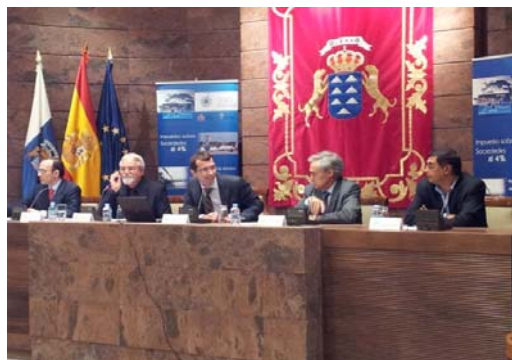
Equipo de expertos autores del estudio